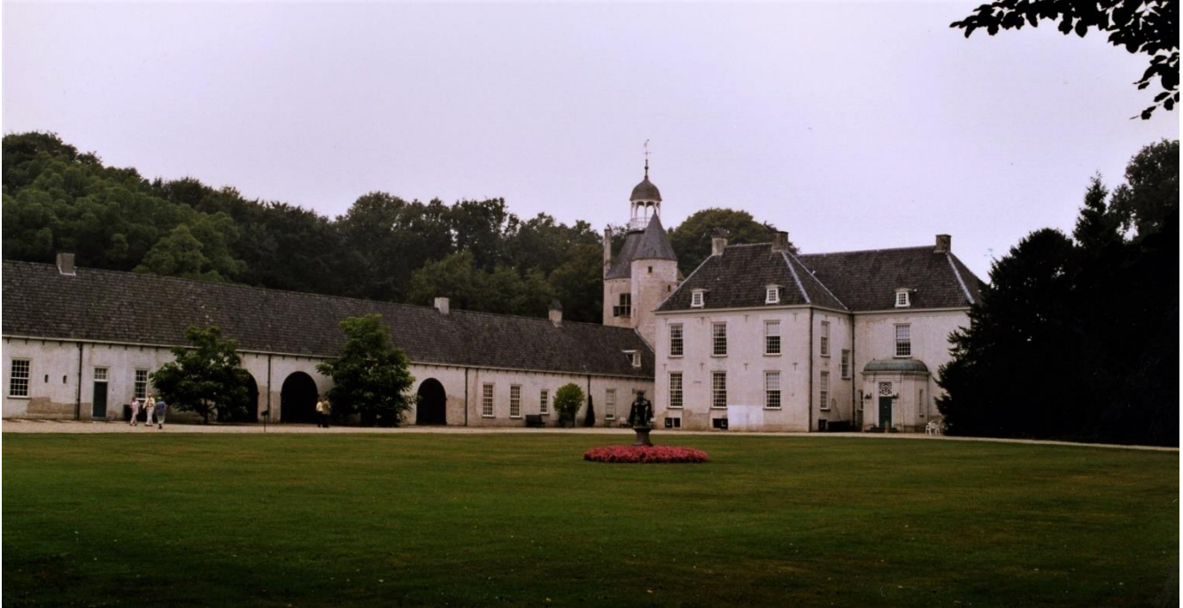
Huis Wisch met de karakteristieke 90 m lange zijvleugel.

hoofdgebouw dat uit de 16de en 17de eeuw dateert. Aan de oostzijde van de toren de uit ca 1700 stammende, 90 meter lange dienstvleugel die wordt afgesloten door een zware vierkante toren. In de Tweede Wereldoorlog werd tijdens een geallieerde luchtaanval het huis zwaar getroffen, waardoor het voor een groot deel werd vernield. In 1951 begon de eigenaresse van het huis, mevrouw O.M.I. Vegelin van Claerbergen-jonkvrouwe van Schuylenburch, met de restauratie van het oostelijke deel van de lange dienstvleugel en in 1960-1962 volgde de restauratie van het hoofdgebouw onder leiding van architect Canneman. Deze restauratie van het kasteel betekende het herstel van de oude hoofdvormen van het huis. Aangezien er in het huis nauwelijks nog constructieve en decoratieve elementen aanwezig waren, werd een groot deel van het interieur vervangen. De oorspronkelijke raamindeling bleef tijdens de restauratie gehandhaafd.