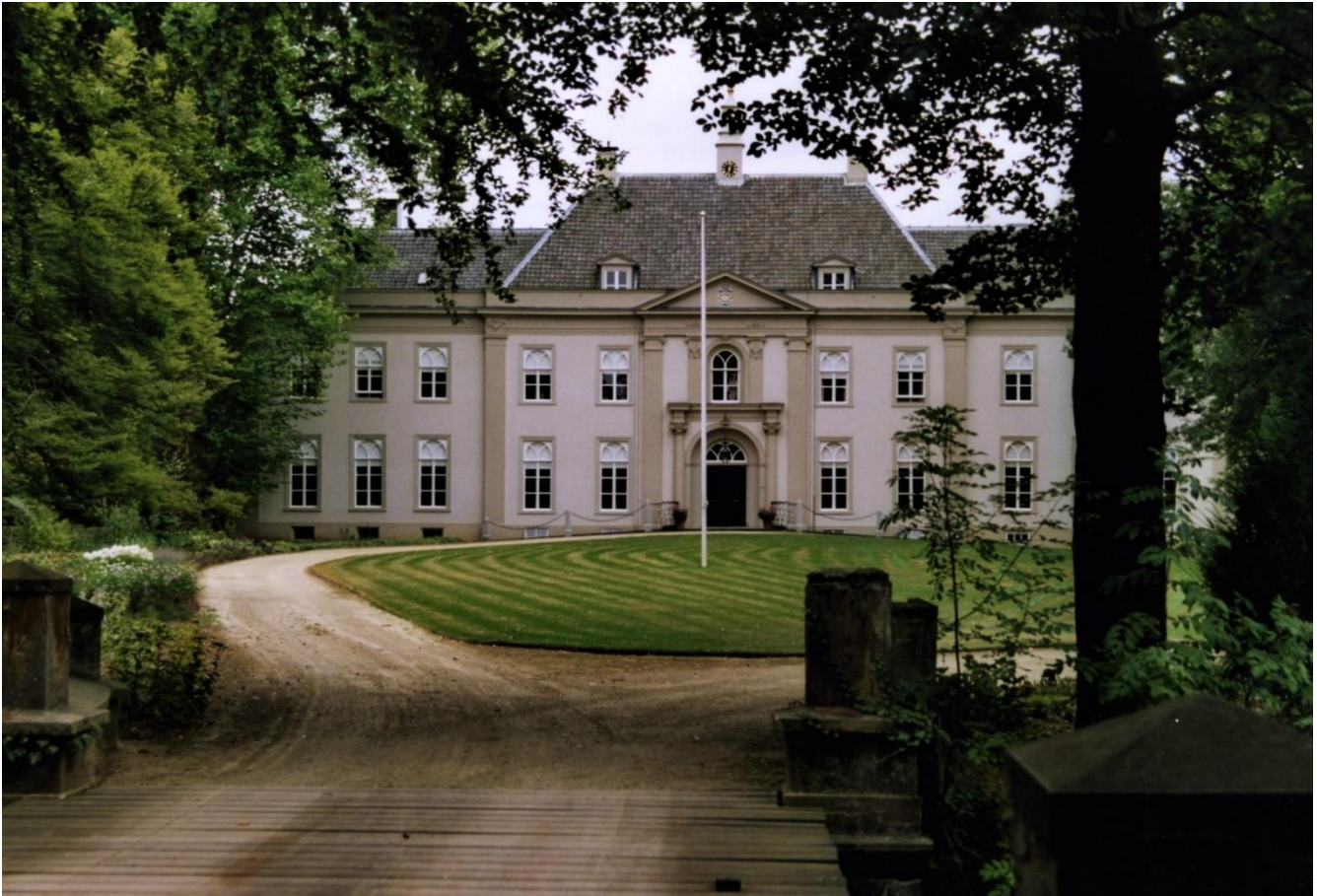
Huis Landfort vóór de recentelijke restauratie.

Langs de Oude IJssel, dicht tegen de Duitse grens bij Anholt, vind men de buitenplaats Landfort. Het landhuis wordt omgeven door een fraai parkbos met bijzondere bomen en veel water. In 2016 sloot de Stichting Geldersch Landschap en Kasteelen (GLK) een overeenkomst met stichting Erfgoed Landfort (sEL) voor de langdurige pacht van het centrale deel van het landgoed met het landhuis, koetshuis, park en moestuin. Op die zes hectare heeft sinds 2017 een ware metamorfose plaatsgevonden.